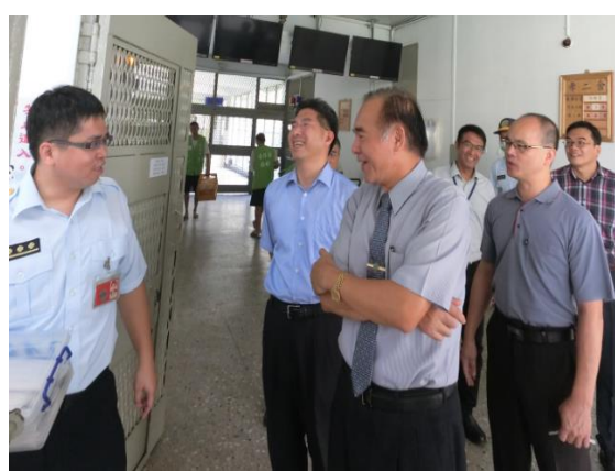
署長關心本所同仁加班情況