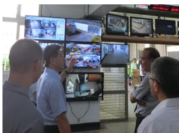
署長視察戒護業務

署長關心同仁加班情形，垂詢業務推動之困難需協助之處，並嘉勉同仁持續共同為矯正業務打拼。同日上午 11 點 20 分許，由本所所長及郭典獄長鴻文陪同續視察臺南監獄。