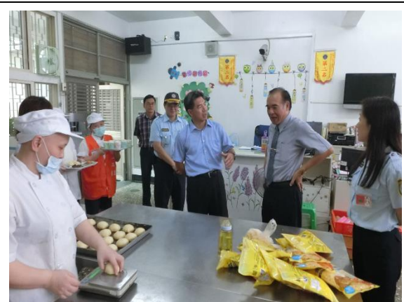
署長視察本所食品科作業情形