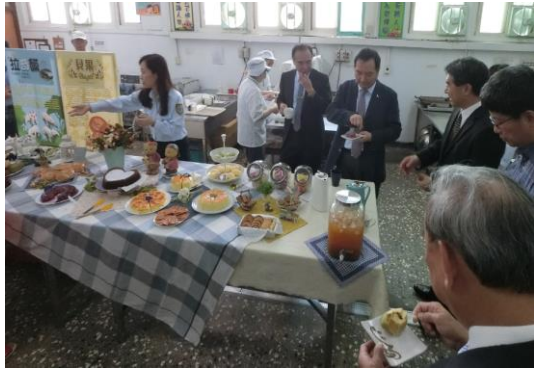
本所展示食品科技訓成果及績效