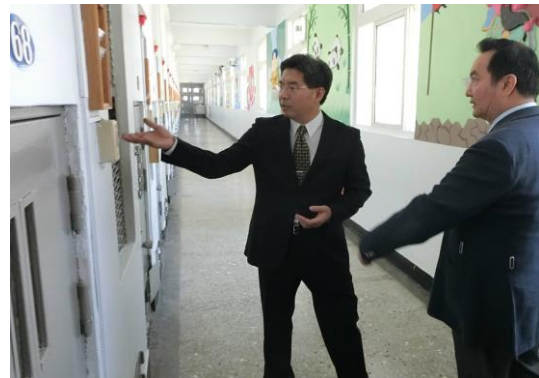
劉所長解說極刑收容人生活環境